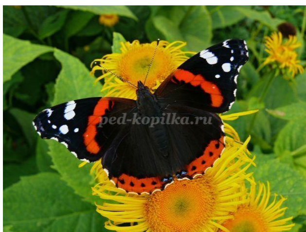
1. Бабочка Адмирал